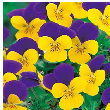
⑬ ゴールドパープルウイング