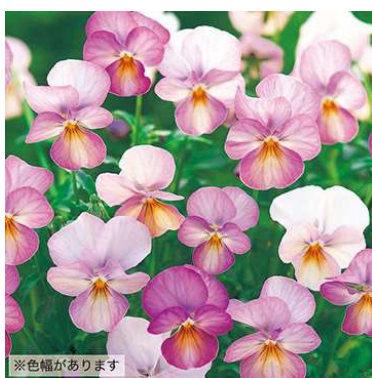
⑮ ピンクアンティーク