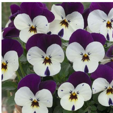
⑭ パープルパールズ