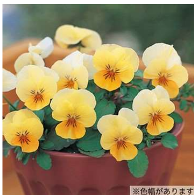
⑫ アプリコットリップ