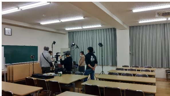
安城市からプロジェクトの取材