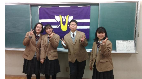
初の生徒同士の交流が成功