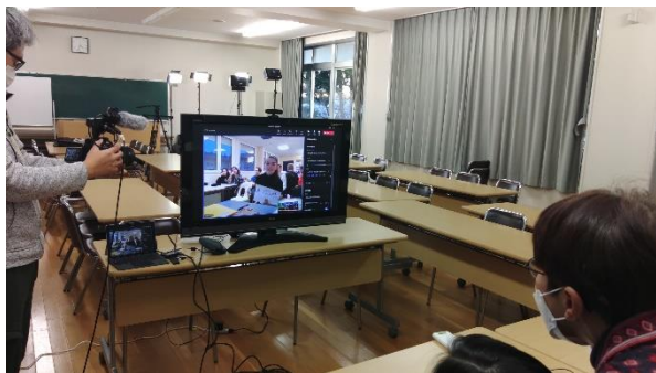
フランスの生徒から自己紹介