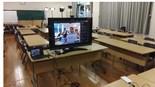
フランスの生徒からは9名が参加