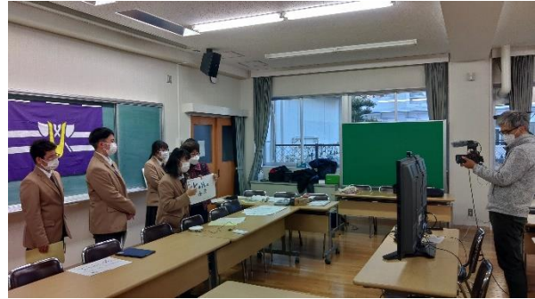
本校の生徒から自己紹介