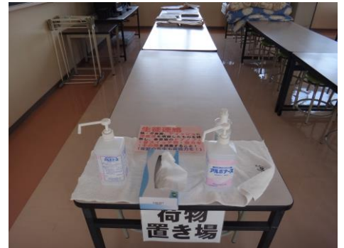
食堂手指消毒場 (写真A)